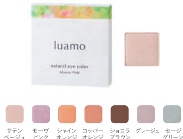
サテン ベージュ モーヴ ピンク シヤイン オレンジ コッパー オレンジ ショコラ ブラウン グレージュ セージ グリーン