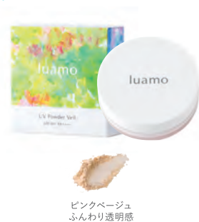
ピンクベージュ ふんわり透明感

植物由来の 保湿成分 エーデルワイス花 / 葉エキス ラベンダー花エキス セイヨウサンザシ果実エキス ゴヨウマツ種子油