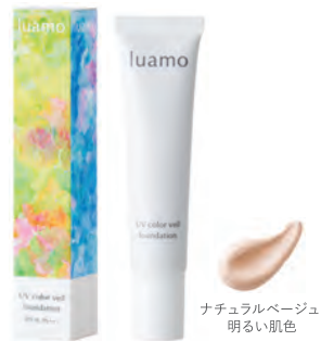
ナチュラルベージュ 明るい肌色

植物由来の 保湿成分 ラベンダー花エキス パオパ種子油 オリーブ葉エキス 植物由来の 整肌成分 リモニウムナルボンセ花 / 葉 / 莖エキス (シーラベンダー) フラレーン