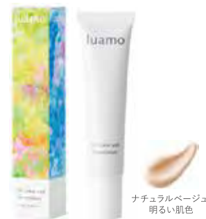
ナチュラルベージュ 明るい肌色