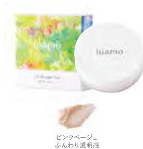
ピンクベージュ ふんわり透明感